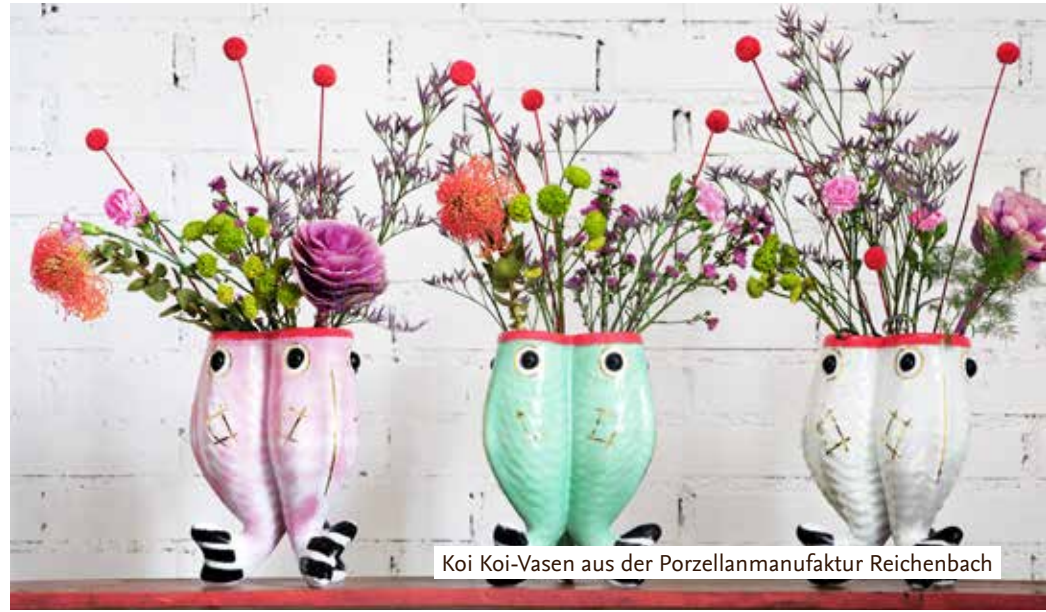
Koi Koi-Vasen aus der Porzellanmanufaktur Reichenbach