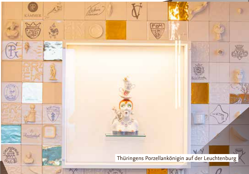
Thüringens Porzellankönigin auf der Leuchtenburg