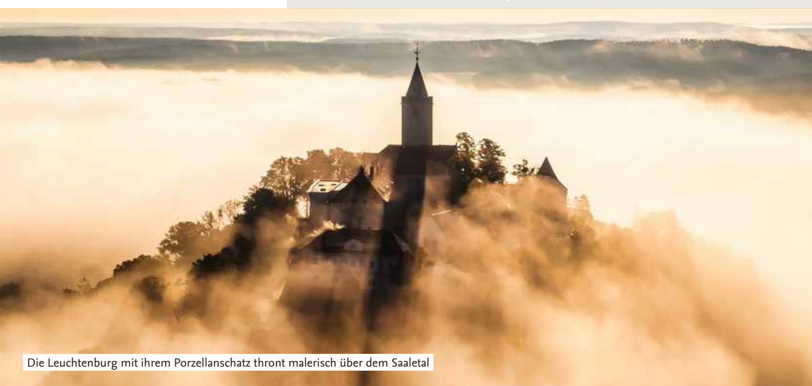
Die Leuchtenburg mit ihrem Porzellanschatz thront malerisch über dem Saaletal