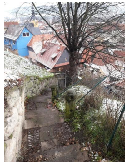
Vor Beginn des Vorhabens