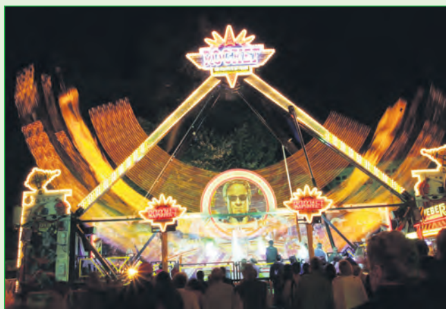
Eine der Attraktionen des Vogelschießens 2008 – Das Fahrgeschäft Rocket